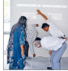
■ कर्ण कैनाल व सेक्टर-13 के सड़क सुदृढीकरण, कबड्डी हाल तथा तालाब के सौंदर्यकरण कार्य का किया निरीक्षण