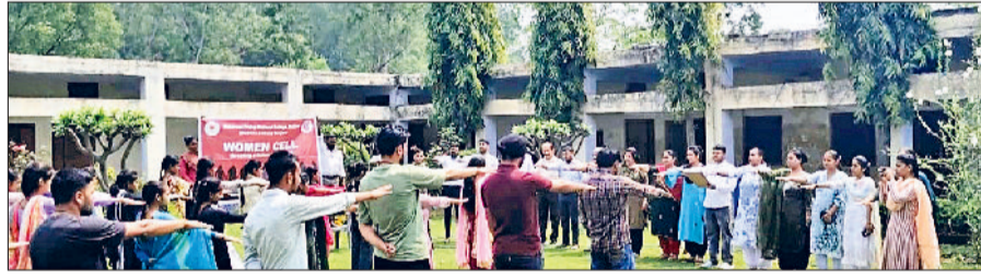
बराड़ा। शपथ लेते हुए कॉलेज स्टूडेंट्स।