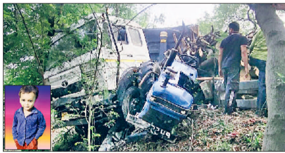
यमुनानगर। हादसे में क्षतिग्रस्त ट्रैक्टर-ट्राली व डंपर तथा मृतक का फाइल फोटो।

शहर के बाईपास पुल पर हुए दर्दनाक सड़क हादसे में डंपर को टक्कर लगने से तीन वर्षी बच्चे का शव दो हिस्सों में बंट गया। वहीं, अन्य स्थानों पर हुए हादसों में तीन लोगों की मौत हो गई। पुलिस ने चोरो शवों को कब्जे में लेकर पोस्टमार्टम करवा परिजनों को सौंप दिया। पुलिस ने अज्ञात