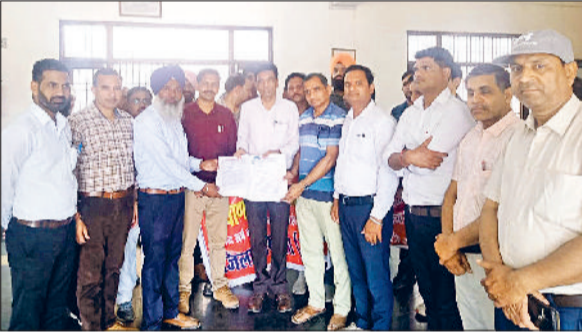
अंबाला। जिला शिक्षा अधिकारी को ज्ञापन सौंपते शिक्षक।

हरियाणा राजकीय अध्यापक संघ और हरियाणा विद्यालय अध्यापक संघ ने बुधवार को शिक्षा सदन अंबाला पर जोरदार प्रदर्शन किया। इस दौरान जिला शिक्षा अधिकारी को शिक्षा मंत्री और मुख्यमंत्री के साथ निदेशक स्कूल माध्यमिक शिक्षा हरियाणा और निदेशक स्कूल मौलिक शिक्षा हरियाणा के नाम ज्ञापन सौंपा। अध्यापक संघों के पदाधिकारियों का कहना कि ये विभाग का मनमाना निर्णय है और ये निर्णय सभी अध्यापकों को मानसिक तनाव की ओर ले जाएगा। शिक्षा विभाग को अपनी नीतियों को सरलीकरण ढंग से लागू कारण चाहिए ना कि इनको पेचीदा बनाना चाहिए। अध्यापकों को ज्यादा से ज्यादा समय पढ़ाई के लिए उपलब्ध करवाना चाहिए न कि ऐसी नीतियां होनी चाहिए कि अध्यापक सारा दिन