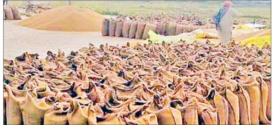
अंबाला। बाहर ग्राउंड में डाली गई फसल का दृश्य।

शपथ ग्रहण की थी। उस दौरान निगम प्रशासन ने सीनियर डिप्टी मेयर के कार्यालय में ही मेयर की कुर्सी लगा दी थी। मेयर शपथ ग्रहण समारोह के बाद सीधा नगर निगम कार्यालय में पहुंची थी। निगम में सभी ब्रांच में अधिकारियों व कर्मचारियों से मिलने के बाद वह अपने कार्यालय पहुंचने के बजाय निगम पार्क में स्वागत कार्यक्रम के बाद चली गई थी। इसके बाद मामला काफी गर्माया था। इसके कुछ दिनों बाद नगर निगम की ओर से सीनियर डिप्टी मेयर का कार्यालय नया बनाया गया था। बताया जा रहा है कि निगम अधिकारियों की ओर से मेयर को अधिकारिक तौर पर कार्यालय में नहीं बिठाया गया है। मेयर कार्यालय में सभी सुविधाओं को भी दुरुस्त नहीं किया गया है।