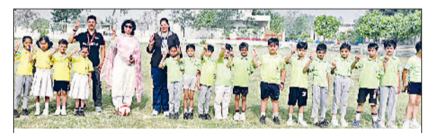
पानीपत। जीडी गोयंका स्कूल में फुटबॉल खिलाड़ी अपनी टीचर्स के साथ।

जीडी गोयंका पब्लिक स्कूल में अन्तर्सदनीय फुटबॉल प्रतियोगिता हुई। चारों सदनों के प्रतिभागियों ने बह-चढ क्रूर हिस्सा लिया। राधाकृष्णन सदन का टेरेसा के साथ और विवेकानंद सदन का टैगोर सदन के साथ मुकाबला हुआ। जिसमें टेरेसा और टैगोर विजयी हुए। तदोपरान्त टेरेसा और टैगोर के बीच