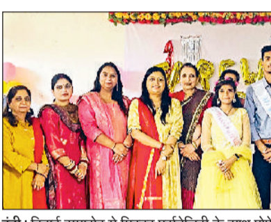
इंदी। विदाई समारोह में मिस्टर पर्सनेललटी के साथ प्रोफेसर।