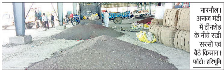
नारनौल। अनाज मंडी में टीनशेड के नीचे रखी सरसों एवं बाँटे किसान।

हरिभूमि न्यूज ▶▶ नारनौल एक अप्रैल से गेहूं की सरकारी समर्थन मूल्य पर खरीद चालू होनी थी, लेकिन जिले की छह मंडियों में से एक भी मंडी में गेहूं बिक्री के लिए नहीं पहुंचा। सप्ताह का दूसरा दिन होने के चलते आज हैफेड द्वारा खरीद की जानी थी, लेकिन गेहूं नहीं आने के कारण पहले दिन उसके हाथ गेहूं के बगैर खाली ही रहे। दूसरी ओर सरसों की आवक एवं खरीद जारी पर रही।