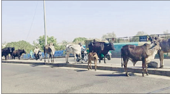
रेवाड़ी। नाईवाली पुल पर लगा गोवंश का जमावड़ा, महाराणा प्रताप चौक के पास सड़क पर घूमते गोवंश।

शहर को स्ट्रे कैटल फ्री बनाने के दावे लंबे समय से किए जा रहे हैं। समस्या स्ट्रे कैटल से ज्यादा पालतू पशुओं की बनी हुई है। एक