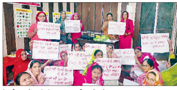
रेवाड़ी। कार्यक्रम में मौजूद आंगनबाड़ी कार्यकर्ता।

कि बेटियों को बचाना व पढ़ाना सरकारी पहल ही नहीं बल्कि यह हम सभी की नैतिक जिम्मेदारी है। यदि हम बेटियों को को सम्मान देंगे तो वे न केवल अपने परिवार का बल्कि पूरे देश का भविष्य उज्वल बनाएंगी। हमें बेटी व बेटों में फर्क नहीं करना चाहिए।