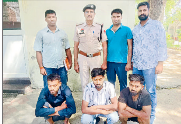
रेवाड़ी। पुलिस गिरफ्त में चोरी के आरोपी।