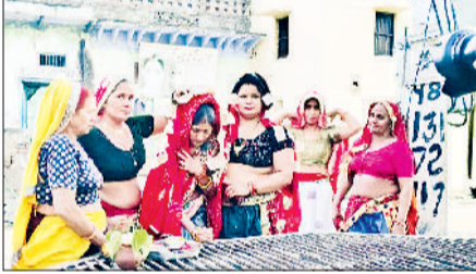
रेवाड़ी। गांव नांगल मूंदी में कुआं पूजन जाती महिलाएं तथा गांव माजरा भालखी में कुआं पूजते हुए महिलाएं।