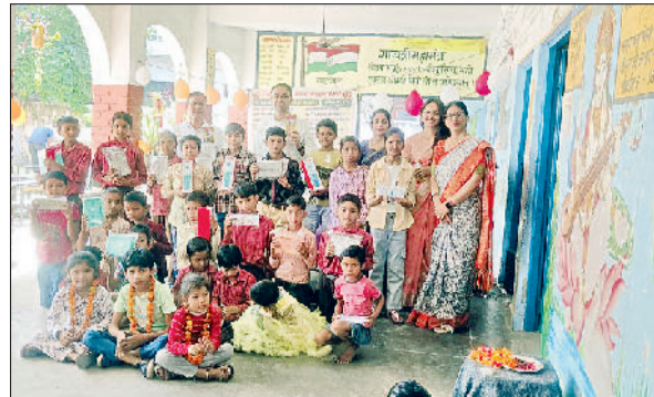
रेवाड़ी। मेधावी विद्यार्थियों को सम्मानित करते शिक्षक।

लिया, इनमें 32 बेटियां तथा 24 बेटे शामिल हैं। ऐसे में लिंगानुपात का प्रतिशत 1333.333 बनता है। उन्होंने ग्रामवासियों का आह्वान किया कि वे बेटियों को बचाएं और उन्हें खूब पढ़ाएं-लिखाएं। आज की बेटियां हर क्षेत्र में देश-प्रदेश का मान बढ़ा रही हैं।