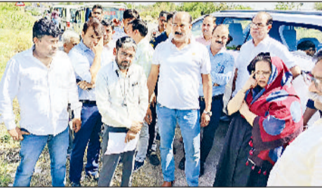
रेवाड़ी। 200 बेड के लिए प्रस्तावित अस्पताल की जमीन का मौका मुआयना करती स्वास्थ्य मंत्री।

स्वास्थ्य मंत्री आरती सिंह राव ने कहा कि सरकार की ओर से प्रदेश के नागरिकों को उच्च स्तरीय स्वास्थ्य सेवाएं देने के लिए सराहनीय कदम उठाए जा रहे हैं। प्रदेश के अस्पतालों को अपग्रेड किया जा रहा है ताकि मरीजों को एक ही छत के नीचे सभी प्रकार की स्वास्थ्य सुविधाएं मिल सकें। स्वास्थ्य मंत्री आरती राव ने मंगलवार को जिले में प्रस्तावित 200 बेड के अस्पताल के निर्माण के लिए गांव गोकलगाढ़, भगवानपुर और माजरा श्यामोज गांव का दौरा करते हुए प्रस्तावित जमीन का मौका मुआयना किया। इस अवसर पर