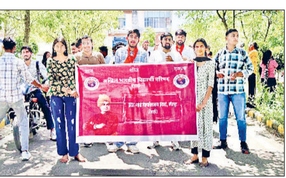
रेवाड़ी। आईजीयू में प्रदर्शन करते एबीवीपी कार्यकर्ता।

अखिल भारतीय विद्यार्थी परिषद की इंदिरा गांधी विश्वविद्यालय इकाई की ओर से विद्यार्थी हितों की मांगों को लेकर प्रदर्शन किया गया। एबीवीपी पदाधिकारियों ने कहा कि एलएलएम कुछ वर्षों से बंद है, जिसे दोबारा इस सेशन में शुरू किया जाए, विश्वविद्यालय में नेट की कॉन्फिग उपलब्ध कराई जाए, विश्वविद्यालय में वाई-फाई व्यवस्था को दुरुस्त किया जाए, विश्वविद्यालय