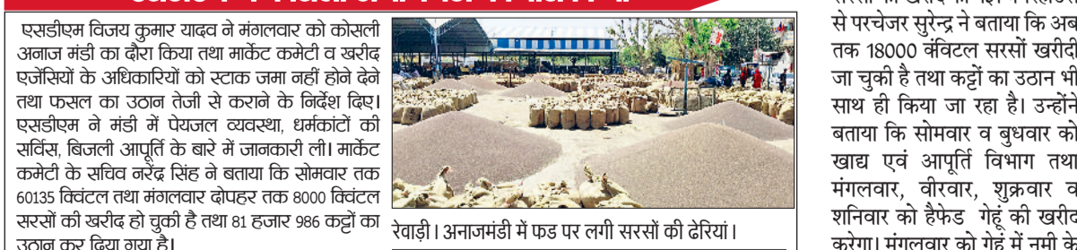
रेवाड़ी। अनाजमंडी में फंड पर लगी सरसों की ढेरियां।