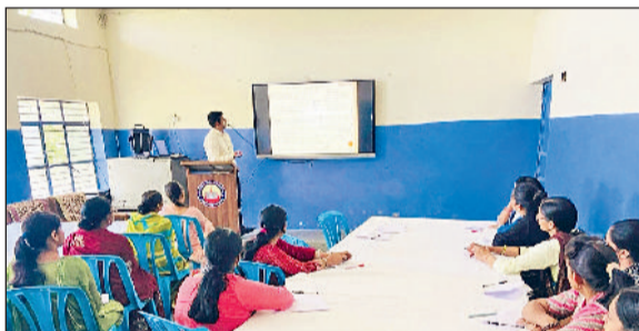
रेवाड़ी। कार्यशाला में अध्यापकों को प्रशिक्षित करते डाइट के विषय विशेषज्ञ।