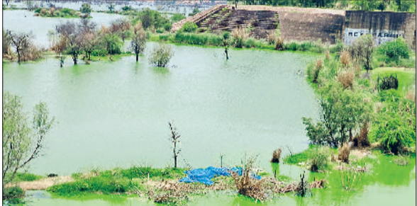
रेवाड़ी। धारूहेड़ा के महेश्वरी मे जमा दूषित पानी से गुजरते वाहन तथा मसानी बैराज में जमा दूषित पानी।

पानी छोड़ रहे हैं, तो दूसरी ओर ग्रुप हाउसिंग सोसायटीज ने सीटीपी तक नहीं लगाए हैं। दूषित पानी को या तो सहजाल मिल के पास पड़ी खाली जमीन की ओर छोड़ा जा रहा है या फिर उसे मसानी बैराज में पहुंचाया जा रहा है। मसानी बैराज का पानी बुरी तरह दूषित हो चुका है। गत दिनों इसमें मछलियां तक मरी हुई मिली थीं। कई गांवों के हैंडपंपों से भी दूषित पानी निकल रहा है, जो पशुओं को पिलाने के लायक भी नहीं है। मामला हाईकोर्ट से लेकर एनजीटी तक पहुंचा हुआ है, परंतु अभी तक ठोस समाधान के नाम पर कुछ नहीं हुआ है। विस में मामला उठने के बाद सरकार की ओर से गठित कमेटी से जुड़े अधिकारियों की टीम ने बीते सप्ताह ही प्रदूषण की स्थिति का जायजा लिया है। बताया जा रहा है कि प्रदूषण नियंत्रण को लेकर भारी खामियां देखने को मिली हैं। कमेटी इसकी रिपोर्ट सरकार को सौंपेगी।