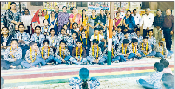
रेवाड़ी। मेधावी विद्यार्थियों को सम्मानित करते शिक्षक।