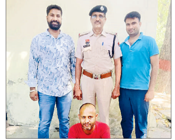
रेवाड़ी। पुलिस गिरफ्त में तेज चोरी का आरोपी।