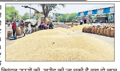
कोसली में 35 हजार विंटल गेहूं खरीद।