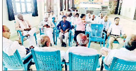
लड़ाई के अग्रदूत कहे जाने वाले मंगल पांडे को नमन किया और दो मिनट का सभी साथियों ने मौन