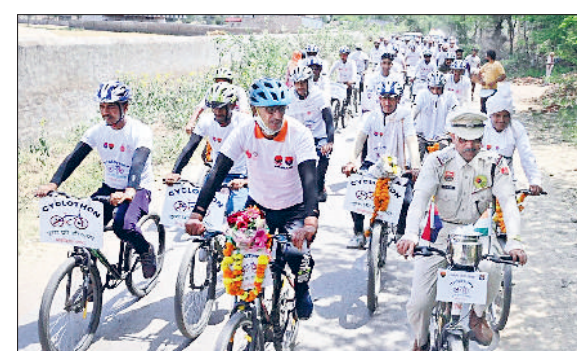
रेवाड़ी। नारनौल रोड से शहर में आते हुए साइकिल यात्रा।