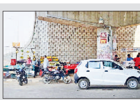
रेवाड़ी। फ्लाइओवर के अंडरपास पर खड़ी रेहड़ियां व वाहन।

दुपहिया वाहन चालक हादसों का शिकार होते रहते हैं। रेहड़ियों के जमावड़े के कारण आए दिन सड़क हादसे हो रहे हैं, परंतु अतिक्रमण साफ करने की दिशा में कोई कदम नहीं उठाए जा रहे हैं।