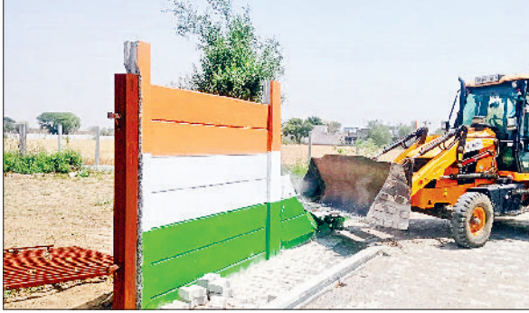
रेवाड़ी। ढोहकी में फार्म हाउस पर तोड़फोड़ करती जेसीबी।

डीटीपी की लगातार चल रही कार्रवाई से अवैध प्लॉटिंग करके कॉलोनियों विकसित करने वाले लोगों में खलबली मची हुई है। जिले में अवैध कॉलोनियों पर चल रही तोड़फोड़ के बावजूद कॉलोनाइजर व डीलर नई कॉलोनियों विकसित करने में लगे हुए हैं। मंगलवार को ढोहकी की राजस्व सीमा में लगभग 12 एकड़ जमीन में विकसित हो रहे फार्म हाउस पर डीटीपी की जेसीबी चली। डीटीपी की ओर से अवैध रूप से हो रहे निर्माण का सर्वे करने