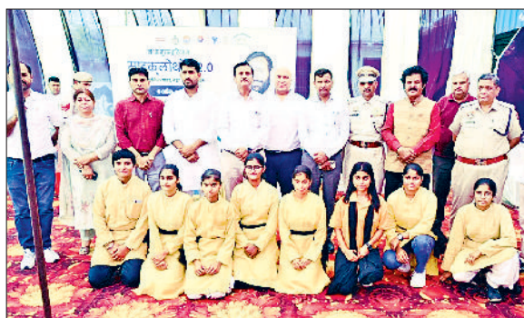
रेवाड़ी। नुकड़ नाटक की टीम विधायक व अधिकारियों के साथ।