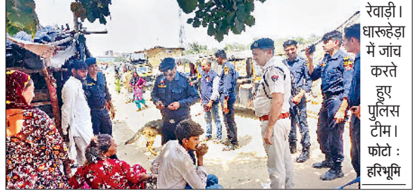
रेवाड़ी। धारूहेड़ा में जांच करते हुए पुलिस टीम।