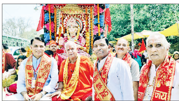
रेवाड़ी। हनुमान जन्मोत्सव के उपलक्ष्य में शोभायात्रा निकालते श्रद्धालु तथा हनुमानजी की शोभायात्रा में शामिल श्रद्धालु।