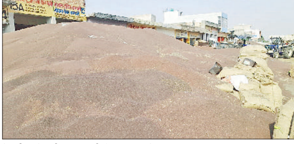
रेवाड़ी। कोसली अनाजमंडी में लगा सरसों का अंबार।

रेवाड़ी व कोसली अनाजमंडी में पिछले पांच दिन से सरसों के साथ गेहूं की भारी आवक हो रही है। रेवाड़ी में हैफेड तथा बावल व कोसली अनाजमंडियों में वेयर हाउस की ओर से 5950 रुपये एमएसपी पर सरसों की सरकारी खरीद की जा रही है। इसके अलावा रेवाड़ी व कोसली अनाजमंडी में हैफेड की ओर से 2425 एमएसपी पर गेहूं की खरीद की जा रही है। बावल अनाजमंडी में मंगलवार को भी गेहूं की सरकारी खरीद नहीं हो पाई। रेवाड़ी अनाजमंडी में मंगलवार को हैफेड