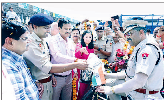
रेवाड़ी। साइकिल यात्रा के पहुंचने पर लोटे में नमक डालते अधिकारी व अन्य, माजरा भालखी से शहर में आते हुए साइकिल यात्रा।