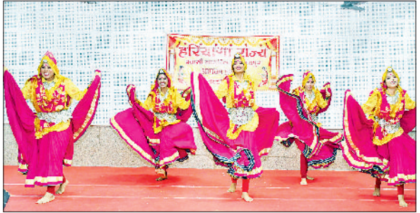
रेवाड़ी। कार्यक्रम में समूह डांस करते हुए संस्था की कलाकार तथा कार्यक्रम के समापन पर अतिथियों के साथ संस्था के कलाकार।