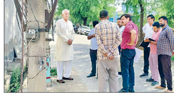
रेवाड़ी। गांव नटेड़ा में मौजूद बिजली निगम के एक्सईएन व अन्य।