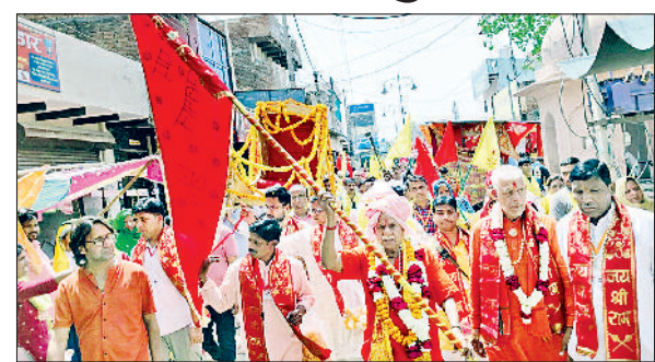
रेवाड़ी। पीटीएम में मौजूद शिक्षक, अभिभावक व विद्यार्थी।

बाद रामायणजी को रथ पर विराजमान किया गया तथा शोभायात्रा भाड़ावास गेट, मोती चौक व पुरानी तहसील होते हुए श्रीराम सत्संग भवन छिपटवाड़ा में सम्पन्न हुई। इसके बाद मंदिर में श्री रामचरितमानस पाठ शुरू किया गया। 9 अप्रैल को श्री रामचरितमानस पाठ की पूर्ति होगी तथा रात 9 बजे से प्रवचन व भजन-कीर्तन होंगे। 10 अप्रैल की