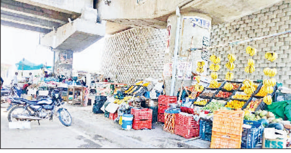
रेवाड़ी। फ्लाइओवर के अंडरपास पर लगा बाजार।

जैसलमेर नेशनल हाइवे पर बने फ्लाइओवरों के नीचे अंडरपास मिनी मार्केट में तब्दील हो चुके हैं। एनएचआई के कर्मचारियों के लिए यह मंथली वसूली का जरिया बन चुका है, जबकि वाहन चालकों को इससे हादसों की आशंका बनी रहती है। बस स्टॉप पर बने अंडरपास पर बड़ी संख्या में रेहड़ी लगाने वाले लोगों ने अतिक्रमण