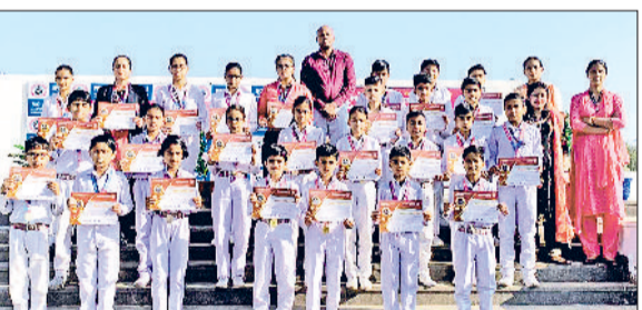
महेंद्रगढ़। ओलंपियाड के पदक विजेता विद्यार्थियों।