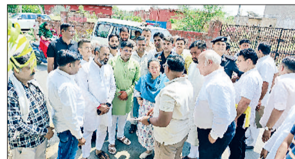
रेवाड़ी। अस्पताल के जमीन निरीक्षण के दौरान चर्चा करते हुए स्वास्थ्य मंत्री।

प्रदेश की स्वास्थ्य मंत्री आरती सिंह राव ने जिले में प्रस्तावित 200 बेड के अस्पताल के निर्माण के लिए चिंहित की जा रही जमीन का मौके पर जाकर निरीक्षण किया। उन्होंने गांव शहबाजपुर खालसा और बैरियावास में प्रस्तावित स्थानों का दौरा करते हुए अधिकारियों के साथ चर्चा की। स्वास्थ्य मंत्री ने कहा कि केंद्र और राज्य सरकार नागरिकों को बेहतरीन स्वास्थ्य सुविधाएं प्रदान करने के लिए प्रतिबद्ध हैं। प्रदेश भर में स्वास्थ्य सेवाओं का लगातार विस्तार किया जा रहा है, ताकि नागरिकों को सुलभ, सस्ती और गुणवत्तापूर्ण चिकित्सा सेवाएं प्राप्त