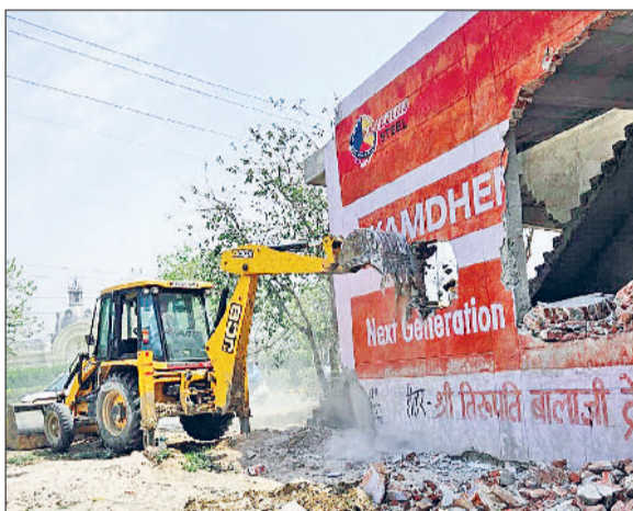
रेवाड़ी। अवैध दुकानों को तोड़ते हुए जेसीबी।

नियमों को ताक पर रखकर कंट्रोल्ड एरिया में बिना अनुमति निर्माण करने वाले लोगों पर डीटीपी का एक्शन तेज हो गया है। डीटीपी का बुलडोजर लगातार ऐसे निर्माण तोड़ रहा है, जिससे निर्माण करने वाले लोगों में हड़कंप मचा हुआ है। तोड़फोड़ रुकवाने के लिए किसी तरह का कोई दबाव काम नहीं आ रहा है, जिससे निर्माण करने वाले लोगों के पसीने छूटे हुए हैं। वीरवार को डीटीपी की टीम ड्यूटी मजिस्ट्रेट और भारी पुलिस बल के साथ गद्दी बोलनी रोड पर फ्रेट कार्रिडोर रेलवे लाइन के पास पहुंची। वहां बिना अनुमति बनाई गई सात दुकानों को जेसीबी से तोड़ दिया गया। दुकान मालिक की ओर से कार्रवाई का विरोध करने का प्रयास भी किया गया, परंतु पुलिस बल की मौजूदगी के चलते किसी की एक नहीं चली। यहां पहले भी तोड़फोड़ की कार्रवाई हुई थी। दुकानों को तोड़ने से पहले विभाग