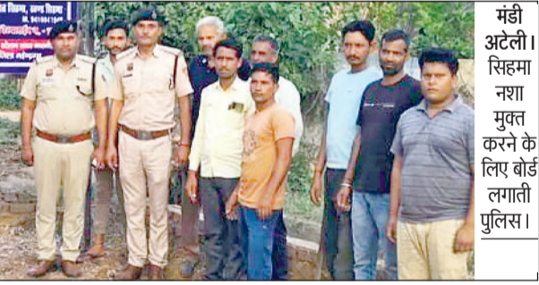
मंडी अटेली। सिहमा नशा मुक्त करने के लिए बोर्ड लगाती पुलिस।