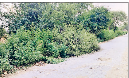
रेवाड़ी। कोसली क्षेत्र में अंधड़ से सड़क पर टूटकर गिरे पेड़।

पश्चिमी विक्षोभ की सक्रियता से बुधवार की रात कई इलाकों में तेज अंधड़ व बूंदबांदी ने मौसम के तेवर ठंडे कर दिए। तापमान में गिरावट आने से भारी गर्मी का प्रकोप कम हो गया। अभी 12 अप्रैल तक मौसम परिवर्तनशील बना रह सकता है। इस दौरान तापमान में और गिरावट आने की संभावना है। दूसरी ओर तेज आंधी के कारण रात को डेढ़ दर्जन से अधिक बिजली फीड ब्रेक डाउन हो गए। विभिन्न गांवों के बिजली के 58 पोल टूट गए, जबकि आंधी में जमीन पर गिरकर 4 ट्रांसफार्मर भी क्षतिग्रस्त हो गए। शहरी क्षेत्र में ज्यादा नुकसान नहीं हुआ। बीते बुधवार तक तीन दिन