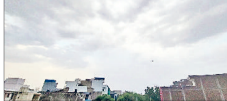
रेवाड़ी। वीरवार शाम को शहर में छाए बरसात के बादल।