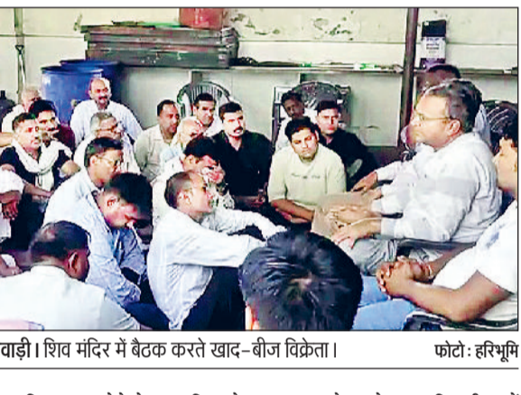
रेवाड़ी। शिव मंदिर में बैठक करते खाद-बीज विक्रेता।