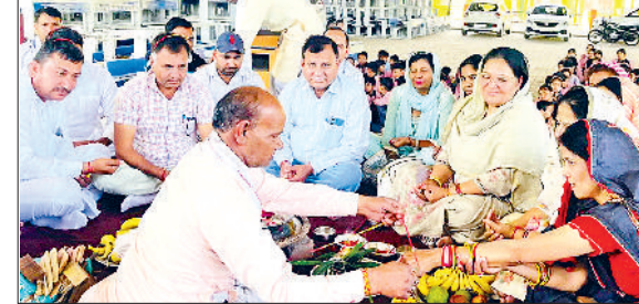
राजकीय स्कूल बेगा में प्रवेश उत्सव के अवसर पर हवन में आहुति डालते शिक्षक।

हवन में प्राचार्य, मुख्य अध्यापिका सहित अन्य शिक्षकगणों ने मंत्रोच्चारण के साथ आहुतियां डाली।