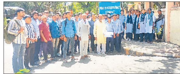
सोनीपत। रोष-प्रदर्शन करते हुए ग्रामीण व छात्र-छात्राएं।

विद्यार्थियों ने मांग की कि जुआं आइटीआई को सरकारी संस्थान के रूप में ही बनाए रखा जाए। ग्रामीणों ने बताया कि इस आइटीआई के लिए