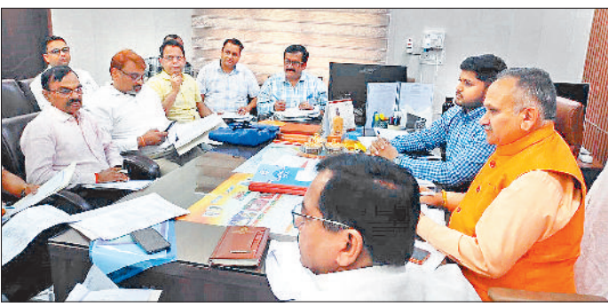
सोनीपत। बैठक के दौरान मौजूद मेयर व अधिकारी।