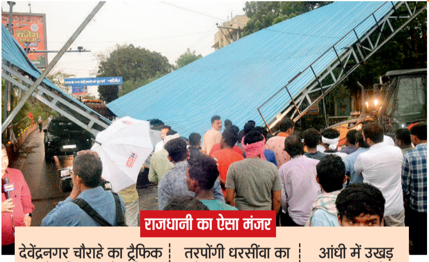
राजधानी का ऐसा मंजर देवद्वनगर चौराहे का ट्रैफिक शोड गिरा, कारें दबी | तरपोंगी धरसीवा का टोल प्लाजा ध्वस्त | आंधी में उखड़ गए दर्जनों पेड़

पश्चिमी विक्षोभ से बदले मौसम ने गुरुवार को राज्य के बड़े इलाके को मुसीबत में डाल दिया। 70 की रफ्तार से चली तेज हवाओं का कहर ऐसा टूटा कि राजधानी समेत कई शहर-कस्बों में बड़े दरख्त, होर्डिंग्स, छज्जे उखड़े गए। अंधड़ के दौरान बेमेतरा में बड़ा हादसा हुआ। यहाँ राइस मिल का छज्जा गिरने से दो श्रमिकों की मौत हो गई। कई घायल भी हैं।