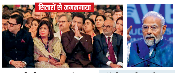
हरिभूमि न्यूज | मुंबई

विश्व दृश्य श्रव्य और मनोरंजन सम्मेलन (वेक्स) 2025 का शानदार आगाज मुंबई में हुआ। इस मौके पर प्रधानमंत्री नरेंद्र मोदी ने सम्मेलन का उद्घाटन किया। यह चार दिवसीय आयोजन मुंबई के जियो वर्ल्ड कन्वेंशन सेंटर में हो रहा है। यह आयोजन न सिर्फ मनोरंजन जगत के लिए एक बड़ा मंच है, बल्कि इसने बॉलीवुड और दक्षिण भारतीय सिनेमा के सितारों को एक साथ लाकर एकजुटता की मिसाल भी पेश की।