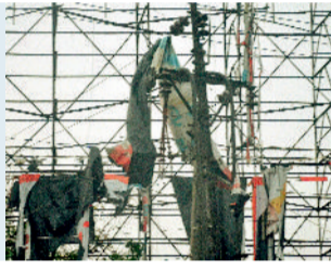
हरिभूमि न्यूज | रायपुर

आज से बड़ेगा पश्चिमी विक्षोभ का प्रभाव : हवा की गति जब 30 किलोमीटर प्रति घंटे से अधिक हो जाती है तो उसे अंधड़ कहा जाता है। मौसम विभाग के अनुसार, एक उत्तर-दक्षिण द्रोणिका दक्षिण-पश्चिम राजस्थान से उत्तर केरल तक 1.5 किमी ऊंचाई तक विस्तारित है। शुक्रवार से पश्चिमी विक्षोभ के प्रभाव पड़ने की संभावना है। इसके कारण बंगाल की खाड़ी से प्रचुर मात्रा में नमी आने की संभावना है। शुक्रवार को कई स्थानों पर हल्की वर्षा होने अथवा गरज-चमक के साथ छोटे पड़ने की संभावना है। कई स्थानों पर इस दौरान अंधड़ चलने, वज्रपात होने तथा ओलावृष्टि होने की भी आशंका बनी हुई है। यही स्थिति 3 मई को भी रहने की आशंका है। प्रदेश में अधिकतम तापमान में गिरावट होने की संभावना है।