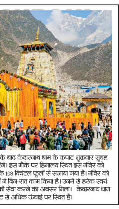
केदारनाथ। सर्दियों में छह माह बंद रहने के बाद केदारनाथ धाम के कपाट शुक्रवार सुबह श्रद्धालुओं के लिए फिर से खोल दिए जाएंगे। इस मौके पर हिमालय स्थित इस मंदिर को देश-विदेश से मंगाने गए विभिन्न प्रकार के 108 किंगटन फूलों से सजाया गया है। मंदिर को सजाने के लिए 150 से अधिक स्वयंसेवकों ने दिन-रात काम किया है। उनमें से हरेक स्वयं की धन्य मानता है कि उसे भगवान शिव की सेवा करने का अवसर मिला। केदारनाथ धाम रुद्रप्रयाग जिले में समुद्र तल से 11,000 फुट से अधिक ऊंचाई पर स्थित है।

पीएम मोदी ने भारतीय सिनेमा की 5 महान हस्तियों गुरु दत्त, पी. भागुमति, राज खोसला, ऋतिक घटक और सलिल चौधरी की याद में डाक टिकट भी जारी किए हैं। टिकट जारी करते हुए पीएम ने कहा, आज वेक्स में इस मंच पर हमने भारतीय सिनेमा के अनेक दिग्गजों को डाक टिकट के माध्यम से याद किया है। बीते वर्षों में मैं कभी गैंगिंग वर्ल्ड्स, कभी स्मूजिक की दुनिया के लोगों से, फिल्ममेकर्स से मिला, कभी स्क्रीन पर चमकने वाले चेहरों से मिला।